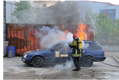
Fognail Einsatz bei PKW Brand.

Neben dem Einsatz bei Wohnungs- und Schiffsbränden wird der Fognail® effektiv bei PKW-, LKW- und Trailerbränden eingesetzt. Durch die Einführung alternativer Antriebe - insbesondere in PKWs - ergibt sich hier eine völlig neue Gefahrensituation für Einsatzkräfte. Durch Tests an gasbetriebenen Fahrzeugen, Wasserstoff- und insbesondere Hybrid- und Elektrofahrzeugen haben die hohe Wirksamkeit der einfachen und robusten Fognail® nachgewiesen. Insbesondere mit dem Einsatz des Kapselmittels F - 500 in sehr geringen Zumischraten ist es möglich auch solche Brände sehr schnell unter Kontrolle zu bringen. Einsätze und Versuche haben auch gezeigt, dass die Standard Herangehensweise an brennende Fahrzeuge mittels Schwer- und Mittelschaum, insbesondere bei alternativen Antrieben zu keinem befriedigendem Ergebnis führt. Auch der Einsatz von Pulverlöschern (Standard Ausrüstung für LKW und PKW) zeigt insbesondere bei verwendeten Lithium Ionen Akkus keine Wirkung. Mit dem Setzen von ein bis zwei Fognails in den Motorraum oder Fahrgastraum - ohne das Fahrzeug öffnen zu müssen - wird der Brand extrem schnell gelöscht und das Fahrzeug auf unkritische Temperaturen heruntergekühlt. Damit erfolgt bei einem herkömmlichen Brand im Fahrzeug nur eine geringe thermische Belastung für die Speichersysteme von LPG/LNG und Wasserstoff. Auch die im Fahrerraum gelagerten Lithium Ionen Akkus