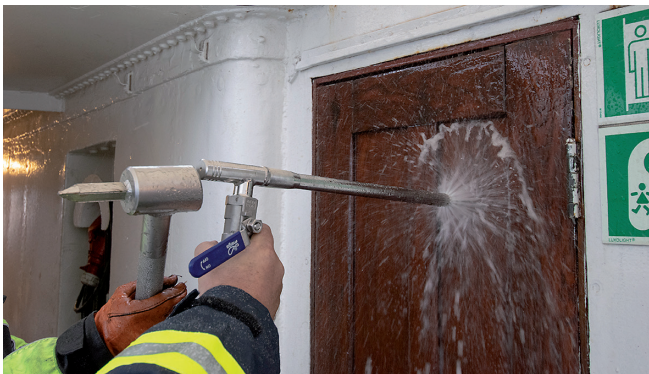
Fognail im Einsatz.